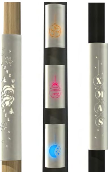
Collection de Noel - Christmas collection