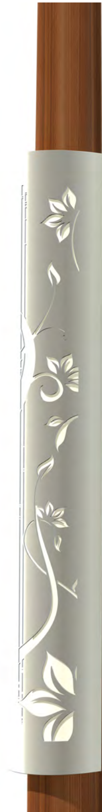
Collection Floral - Floral Collection

Découpes personnalisées sur demande - Customizable cutting on request